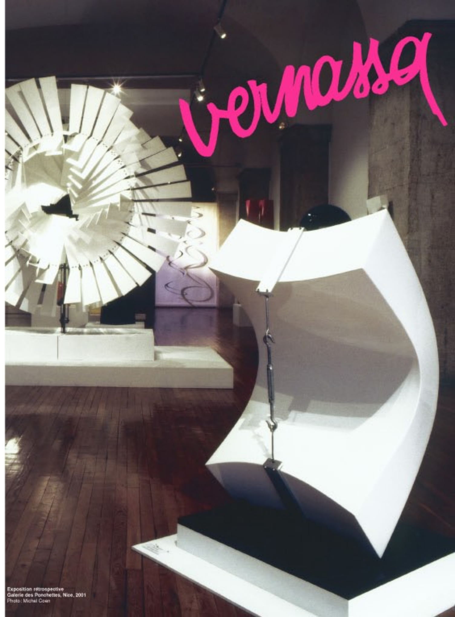
Exposition rétrospective Galerie des Ponchettes, Nice, 2001