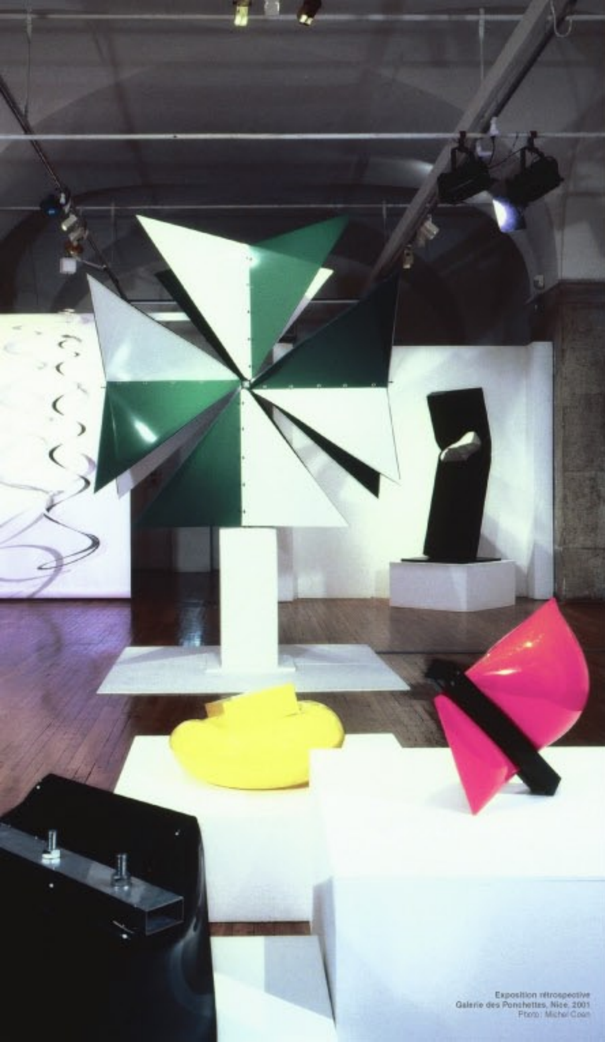
Exposition rétrospective Galerie des Ponchettes, Nice, 2001