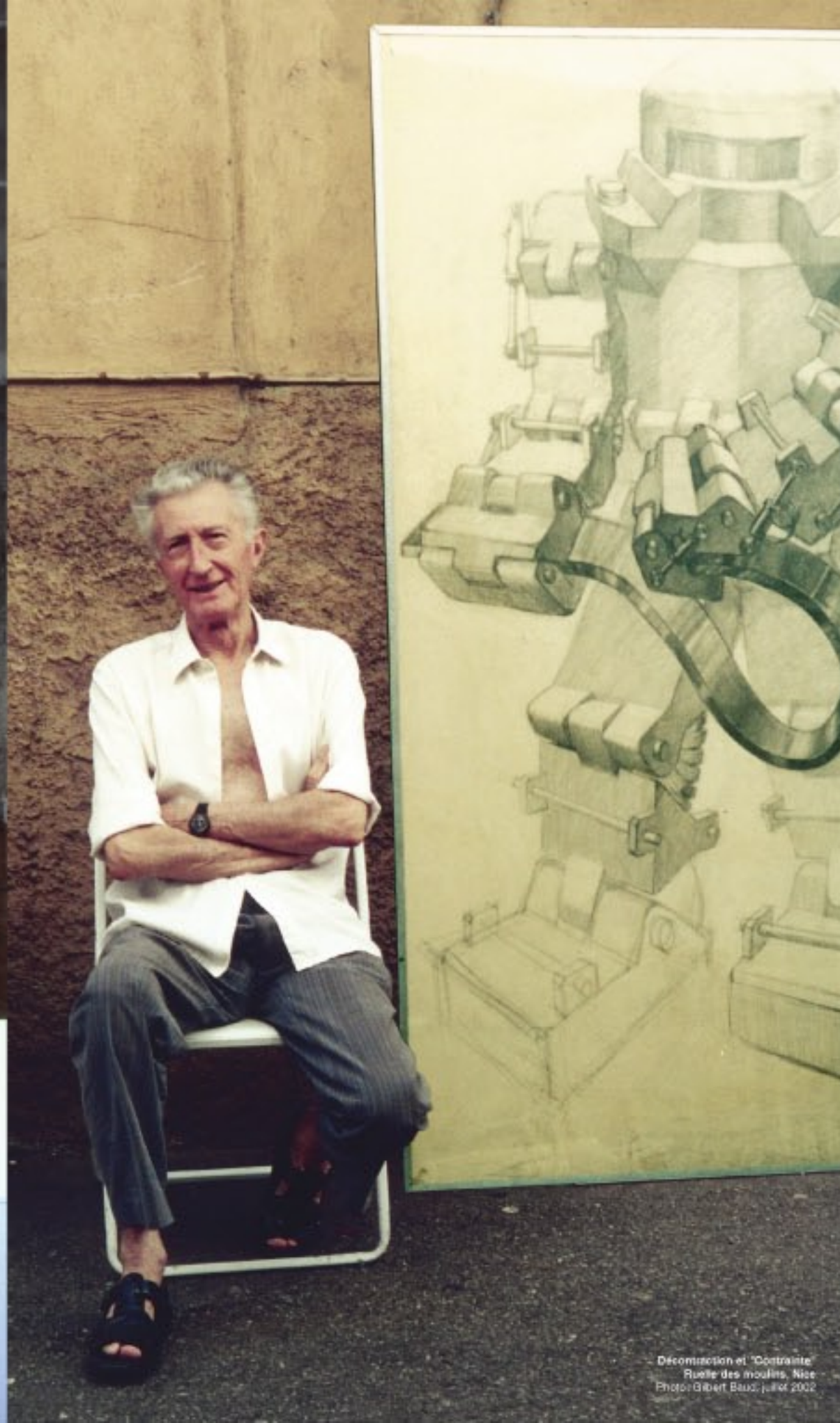
Déconnexion et "Contrainte" Ruelle des moulins, Nice Photo: Gilbert Baud, juillet 2002