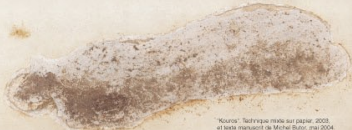
"Kouros". Technique mixte sur papier, 2003, et texte manuscrit de Michel Butor, mai 2004