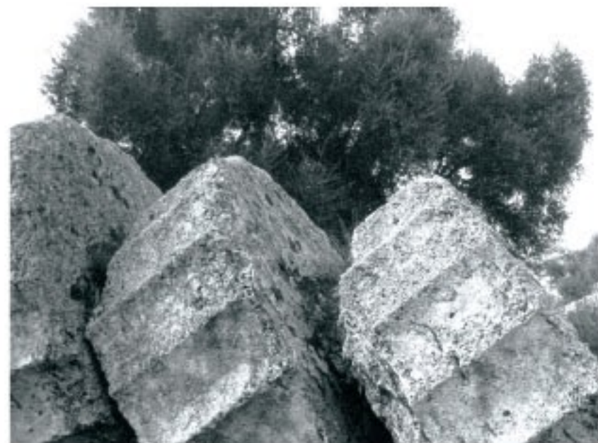
Site du temple de Zeus, Olympie, Grèce. Nov. 2003.