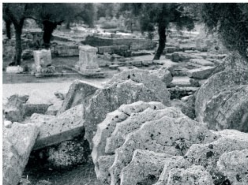
Site du temple de Zeus, Olympie, Grèce. Nov. 2003.