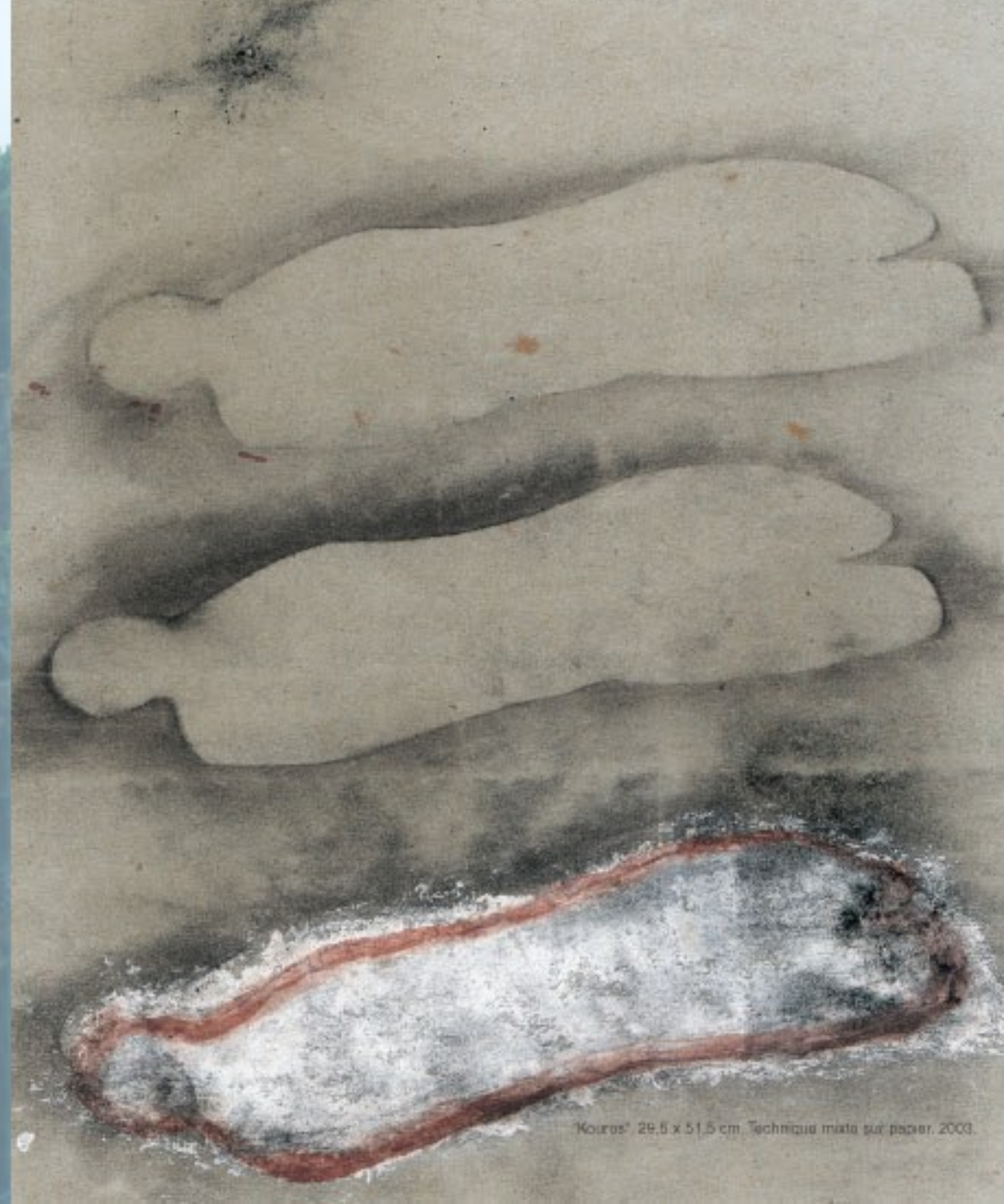
"Kouros". 29,5 x 51,5 cm. Technique mixte sur papier, 2003.